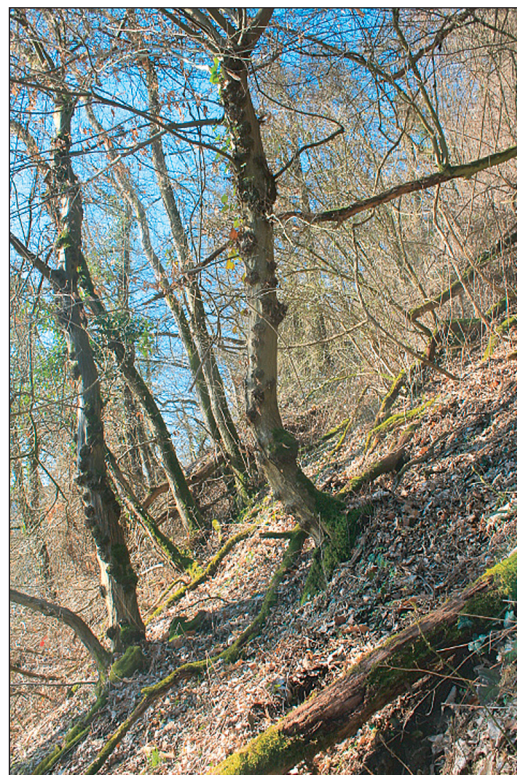
Die Bewirtschaftung von Stockausschlagwäldern mit Hangschutzfunktion erfordert viel waldbautechnisches Know-how. Der Klimawandel ist zusätzlich eine besondere Herausforderung. Der rechte Baum weist wiederum typischen Säbelwuchs auf.

Direkt neben den Demonstrationsflächen werden unbehandelte Monitoringflächen angelegt. Diese bleiben unbewirtschaftet und dienen als Referenzflächen.