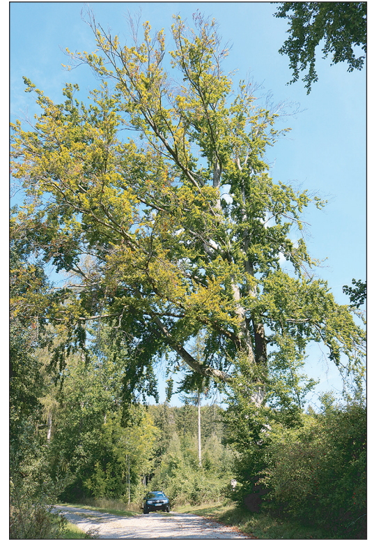
Dürreschäden beim Laubholz lassen sich nur im belaubten Zustand sicher erkennen. Diese Buche beginnt von der Krone her abzusterben. Wegen dem Wuchsort am Weg gilt es die Verkehrssicherung zu beachten.

Basierend auf der Abschätzung der Professur für Forstökonomie und Forstplanung zu den Klimafolgen und mehrerer Expertenworkshops auf den ausgewiesenen Demonstrationsflächen wird ein Behandlungskonzept erstellt, das Empfehlungen für waldbaulichen Anpassungsmaßnahmen für die Stockausschlagwälder mit Objektschutzfunktion beschreibt. □